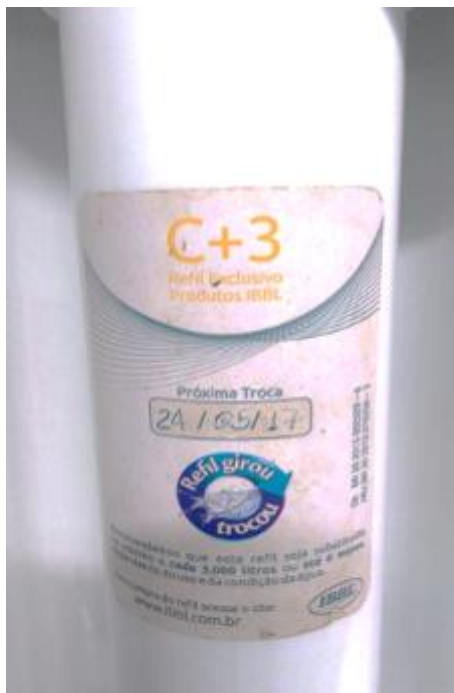
Foto Demonstrativa do Refil do Filtro Utilizada no Pronto Socorro.